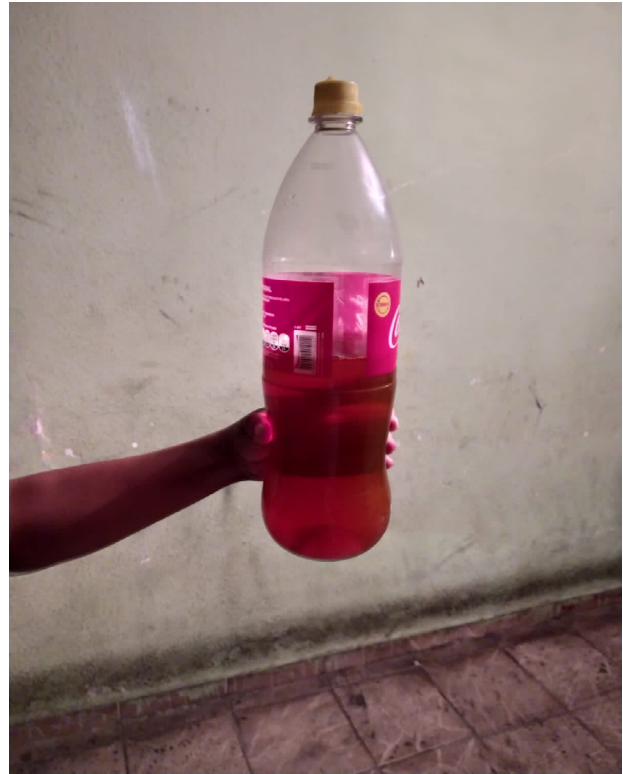
Figura 1. Substância supostamente ingerida pelo paciente.

Recebeu alta após 17 dias de internação, com escórias renais normalizadas e sem sequelas neurológicas.