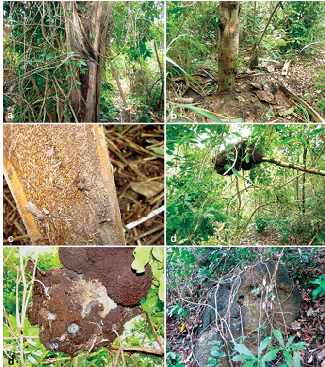
Figura 3 - Ambientes e microambientes naturais habitados por Loxosceles amazonica em Bom Jesus das Selvas, Maranhão. Floresta secundária com palmeira (a, b), aranha-marrom sob folha de palmeira (c), floresta secundária com cupinzeiro sobre árvore (d), cupinzeiro com teias de aranha-marrom (e), afloramento de rocha com teia de aranha em mata secundária (f).

Por fim, no município de Bom Jesus das Selvas, foram registrados focos de L. amazonica (Figura 1) em três remanescentes de floresta secundária, na baixada do rio Pindaré (04°21'30" S, 46°41'14" W, 126 m alt.; 04°21'36" S, 46°42'07" W, 84 m alt.; 04°23'00" S, 46°46'49" W, 98 m alt.), em 05 de fevereiro de 2012. Vários exemplares da aranha associados a teia foram encontrados entre a bainha ou o pecíolo e o caule de folhas secas de palmeiras anajá [ Attalea maripa (Aubl.) Mart.] e babaçu ( Attalea speciosa Mart. ex. Spreng.), em alturas de até um metro do solo; na face inferior e dentro de cupinzeiros sobre árvores, até 2 metros do solo; e no interior de frestas de rochas ferruginosas (canga) no chão da mata (Figura 3). 23