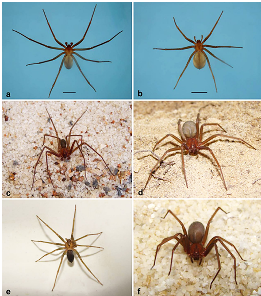
Figura 1 - Espécimes de Loxosceles amazonica . Macho (a) e fêmea (b) adultos coletados em Serra Branca, Paraíba (barras de escala: 5 mm); macho adulto (c) coletado em Itapecuru Mirim, Maranhão; fêmea adulta (d) coletada em Bom Jesus das Selvas, Maranhão; fêmea juvenil (e) e o mesmo exemplar adulto (f) coletada em Serra Talhada, Pernambuco.

Durante expedição pelo interior do estado da Paraíba, encontrei vários exemplares de Loxosceles amazonica (Figura 1) no município de Matureia, incluindo machos e fêmeas adultos, além de juvenis, em 07 de setembro de 2008. Na Fazenda Engenho Bom Conselho, no entorno do Parque Estadual do Pico do Jabre (07°16'13"S, 37°23'18"W, 781 m alt.), foram encontradas aranhas no peridomicílio, em frestas de um muro não rebocado (Figura 2). Nas proximidades, foram encontradas aranhas em meio a telhas de barro entulhadas à margem da estrada de acesso ao referido parque (07°15'42"S, 37°23'10"W, 870 m alt.), na mesma data. Nos dois locais havia teias.