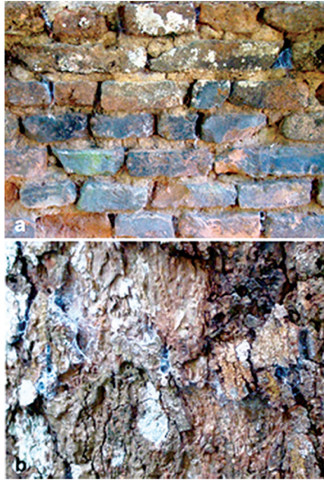
Figura 2 - Microambiente habitado por Loxosceles amazonica no peridomicílio. Frestas em muro sem reboco (a) observado em Matureia, Paraíba, e frestas na casca de tronco de mangueira (b) observada em Arari, Maranhão.

A primeira ocorrência foi considerada sinantrópica, com aranhas associadas a residências, ao passo que na segunda considerou-se possível invasão de área alterada por parte das aranhas.